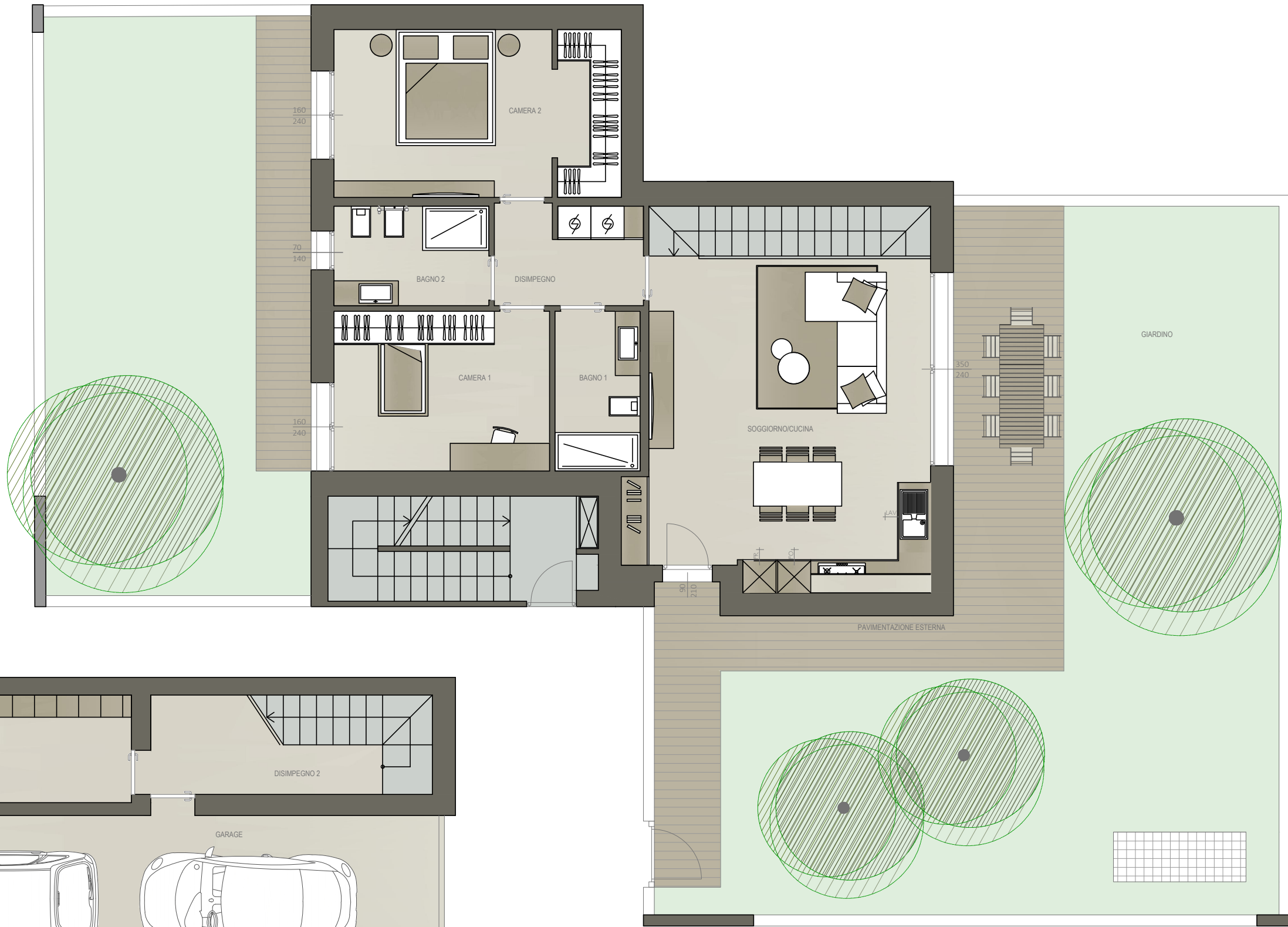
|Piano Terra |