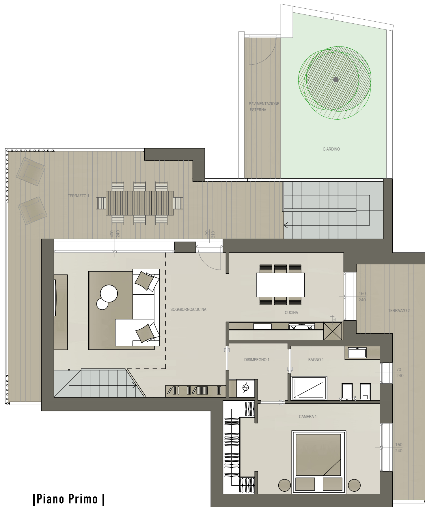
|Piano Primo |