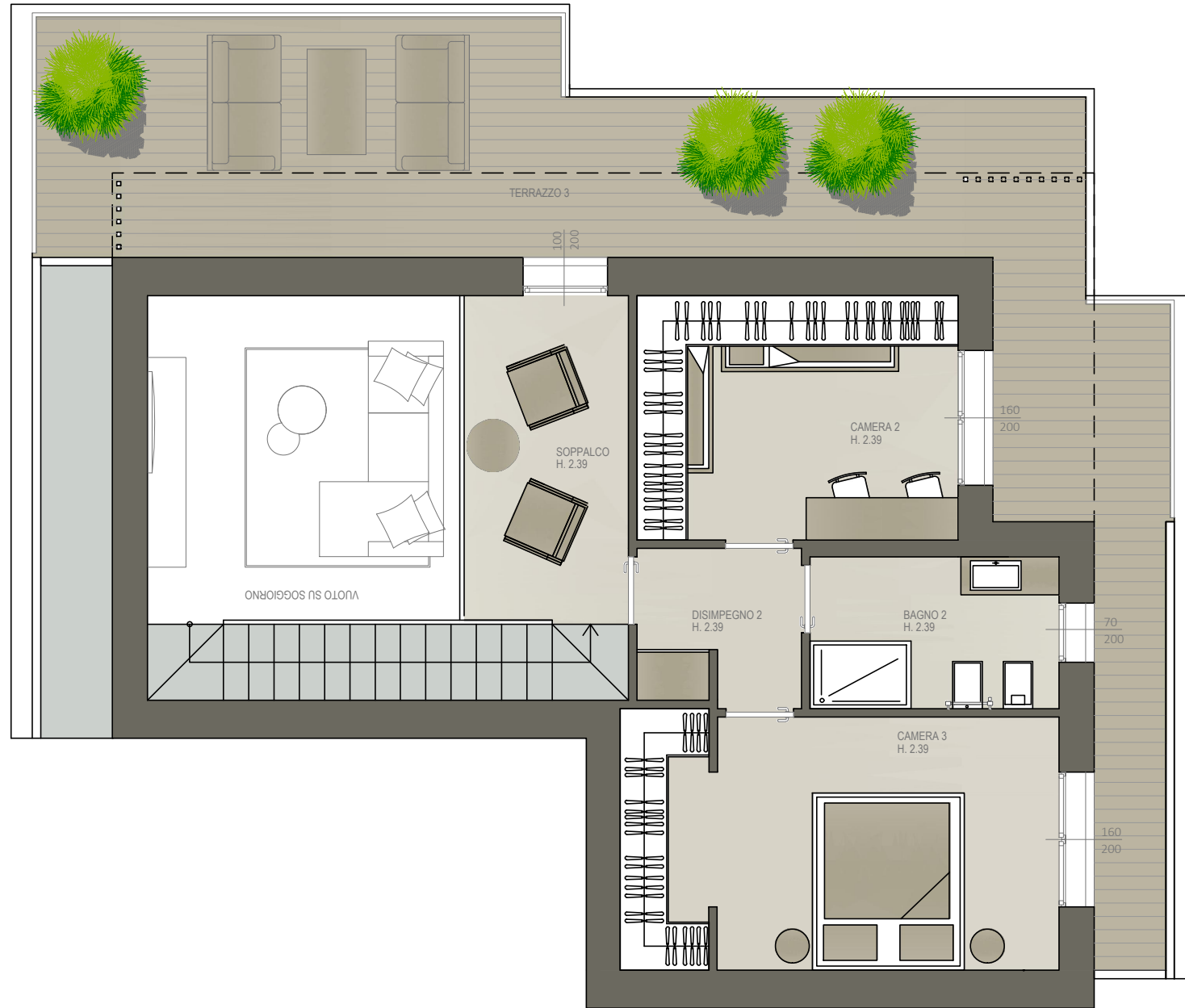
|Piano Sottotetto |